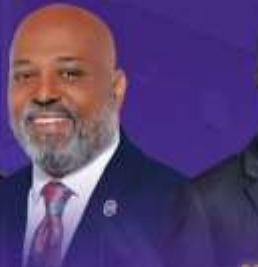
CALVIN HAWKINS AT-LARGE COUNCIL MEMBER